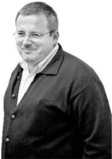
Director de medios digitales

De 10:45 h a 11:00 h /15 minutos para Preguntas y Conversación con los Asistentes.